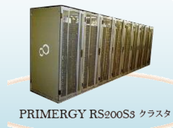
PRIMERGY RS200Ss クラスタ