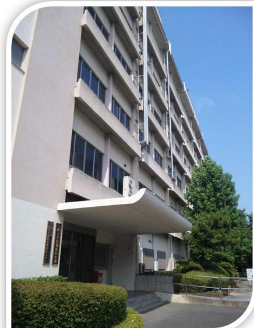
情報基盤研究開発センター 外観