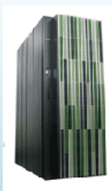
SR16000 モデル L2